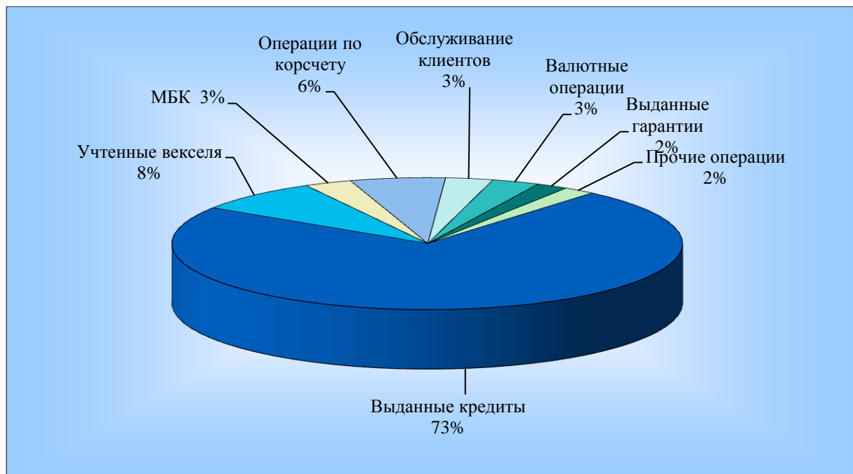
Рис. 1. Структура доходов ООО «XXX» в 2017 г.